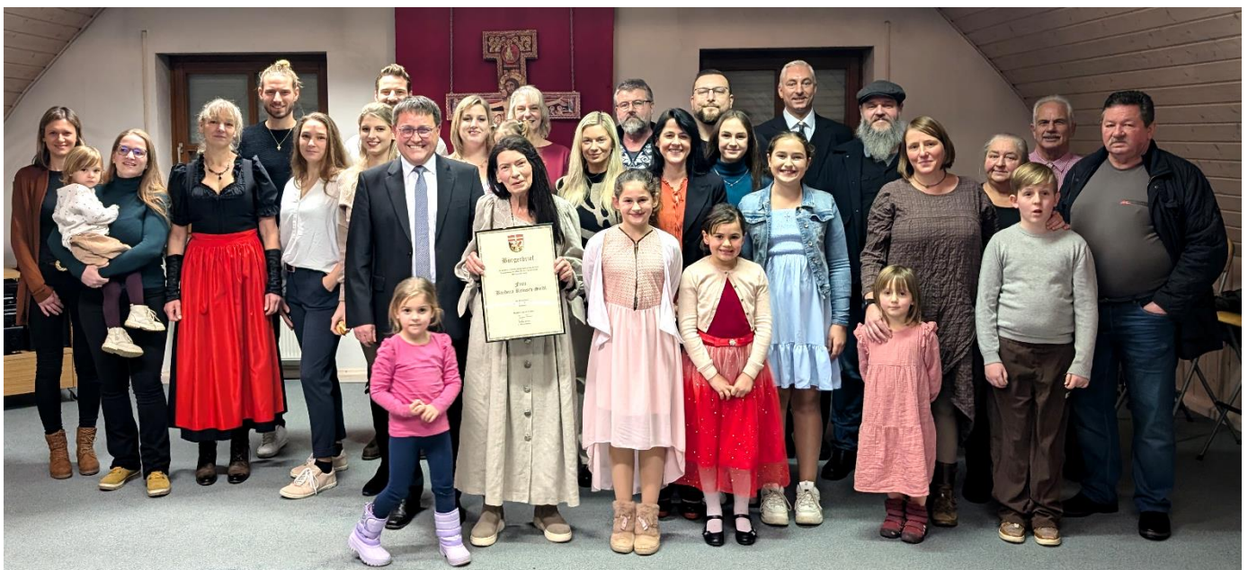
Die Preisträgerin inmitten ihrer großen Familie

Über zwei Jahrzehnte hat sie immer wieder Pflegekinder bei sich aufgenommen, sowohl als Dauerpflegekinder als auch kurzzeitig. Sie hat ihren Kindern – den eigenen und den ihr anvertrauten – ein intaktes familiäres Zuhause gegeben und ein unbeschwertes Aufwachsen ermöglicht. Der Gemeinderat war sich einig, diese große Leistung durch die Verleihung eines Bürgerbriefes zu würdigen.