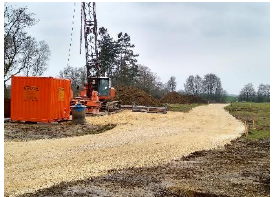
Bauarbeiten im Blindheimer Brunnenfeld

Die BRW versorgt rund 120.000 Menschen mit Trinkwasser. Rund 55.000 davon direkt als Tarifabnehmer (Endkunden) und weitere 65.000 über Städte und Gemeinden, welche als sogenannte Vertragsabnehmer Trinkwasser von der BRW beziehen. Die Vertragsabnehmer bringen dann über ihre eigenen kommunalen Wassernetze das Wasser zu ihren Bürgern.